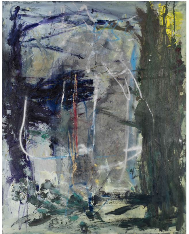
「He Knows Me」