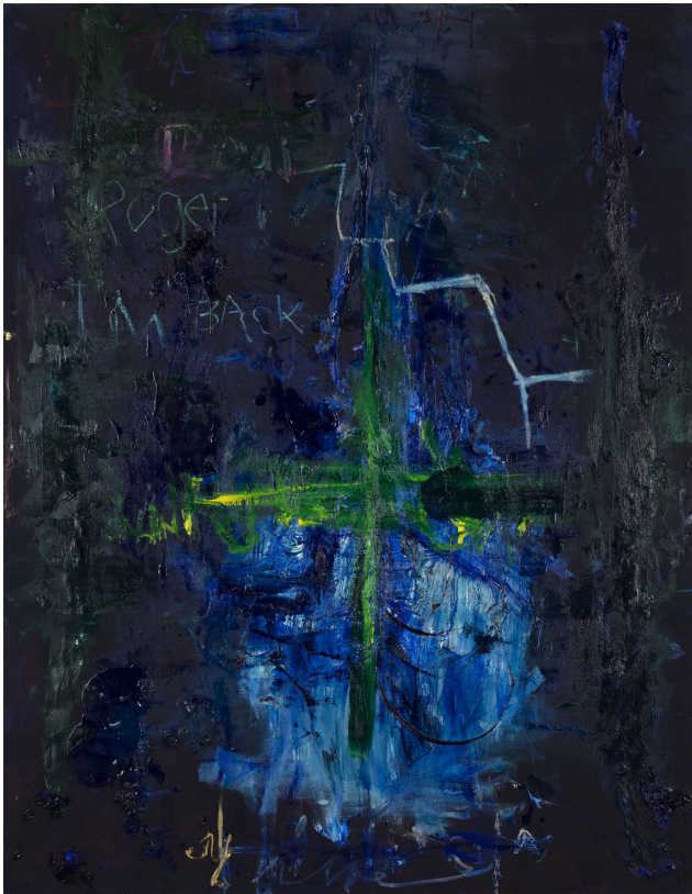
「Dear Roger, I'm Back」