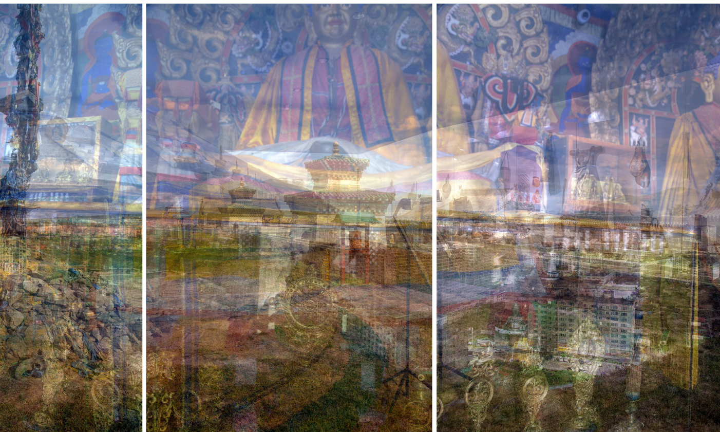
“Panning of Days -Syncretism / Palimpsest-” [5Days]