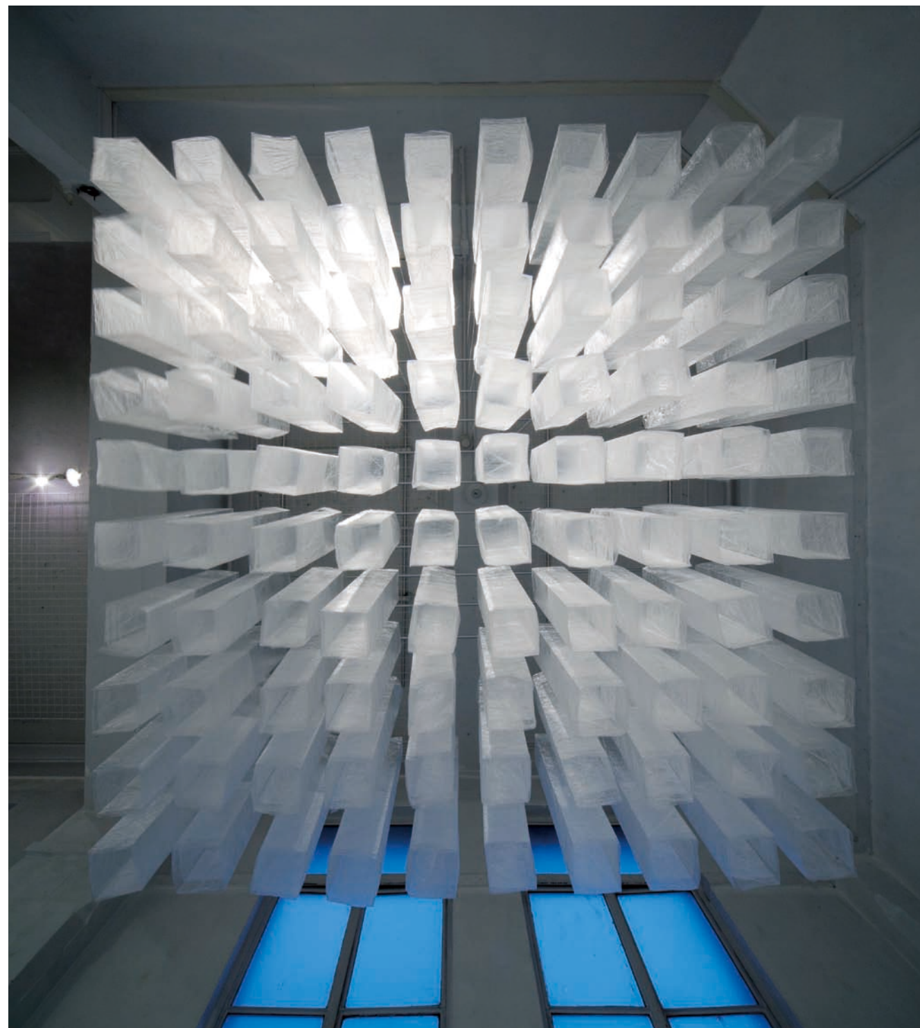
間 ポリプロピレンフィルム H100×W200×D200cm 2011年