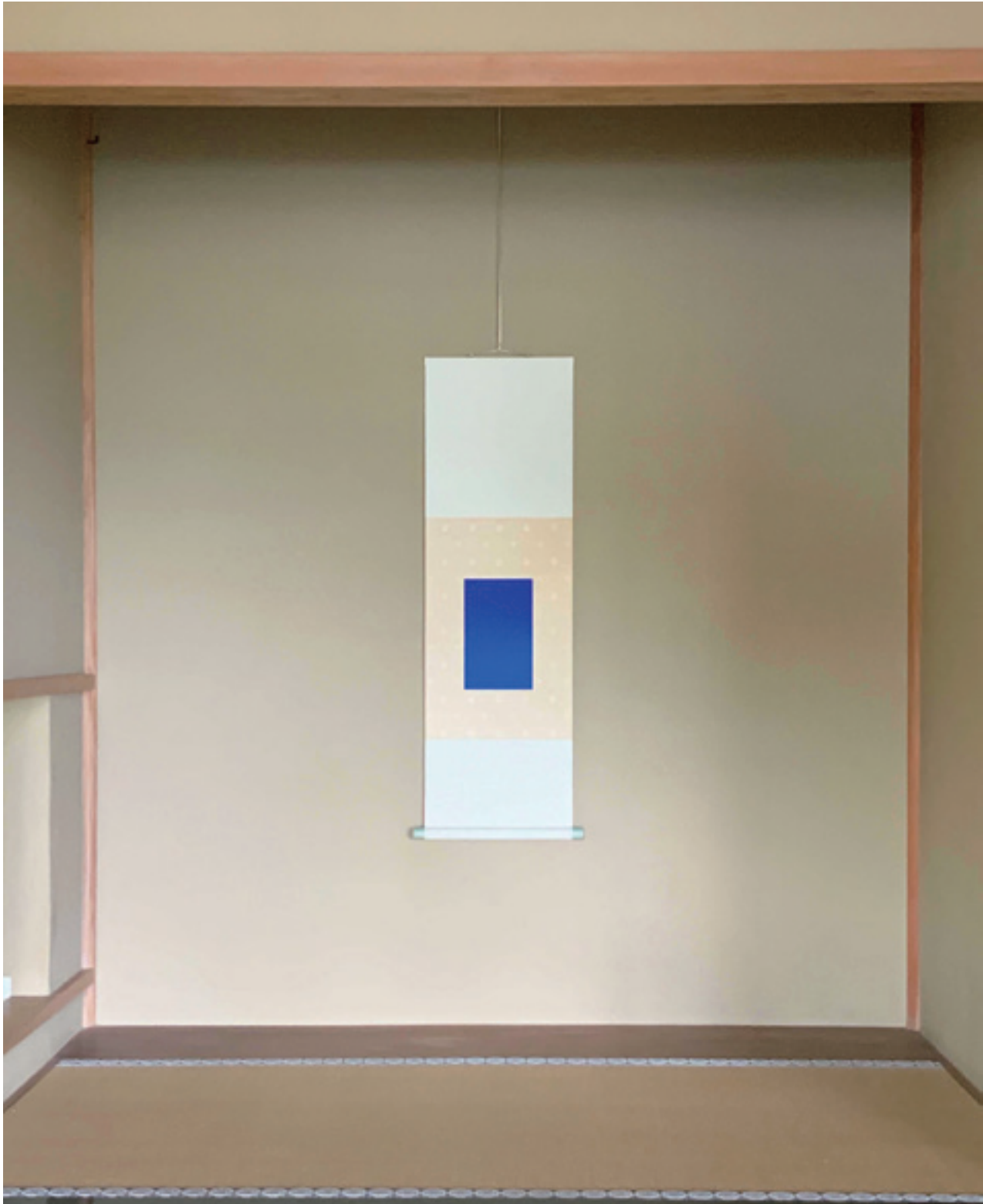
「milestone」 絹にアクリル絵具、H110×W34cm（本紙H25×W15.5cm） 2019年