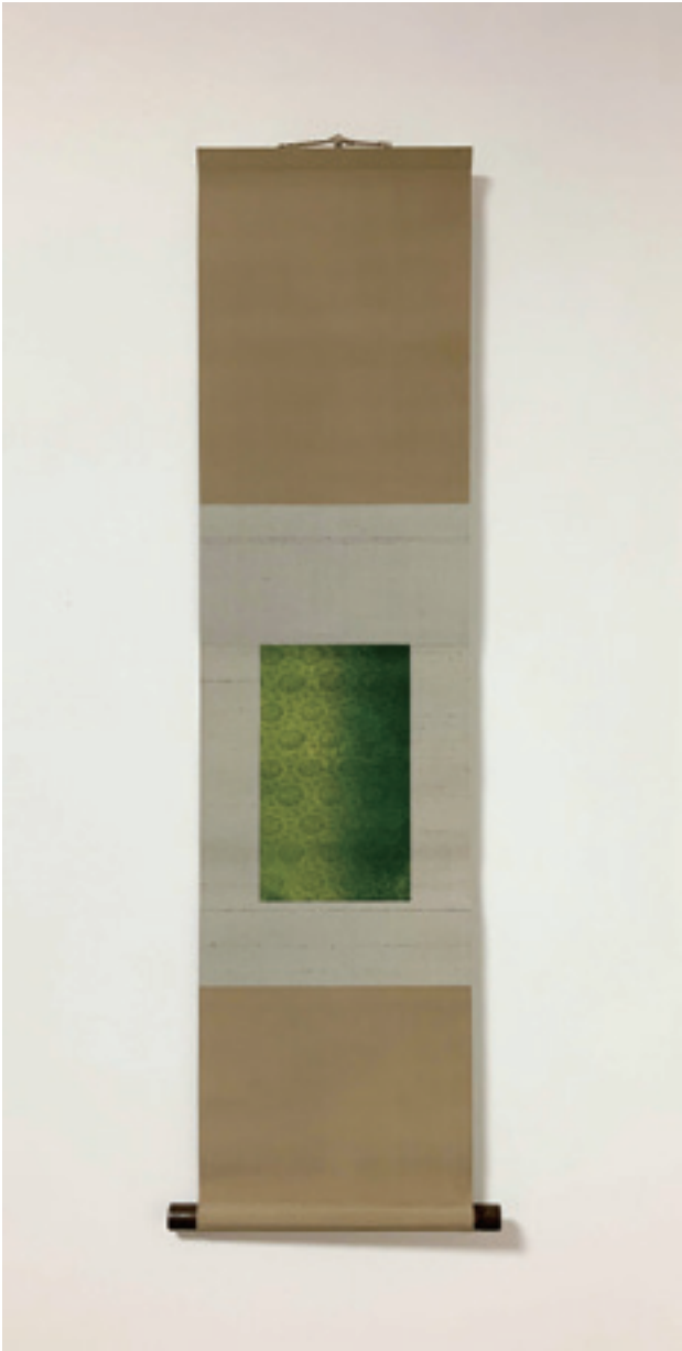
「chord」 絹にアクリル絵具、H104×W26cm（本紙H24×W14.5cm） 2019年