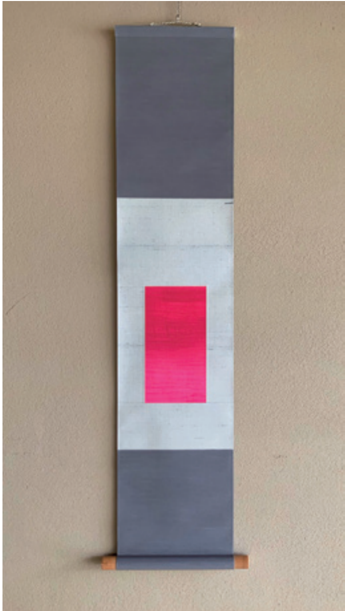
「pink」 絹にアクリル絵具、H105×W22cm（本紙H22×W12cm） 2019年