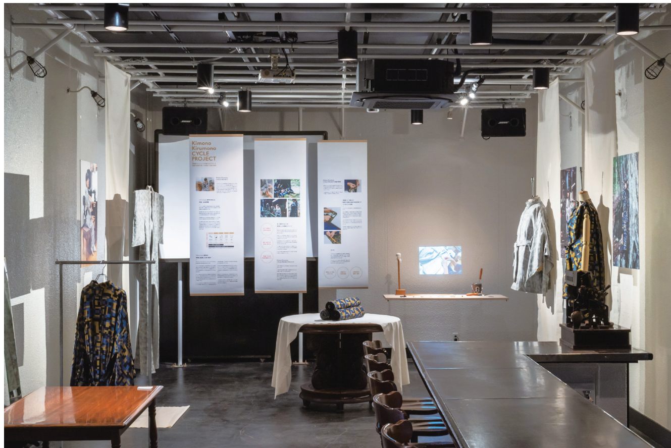
展示風景 | 全景