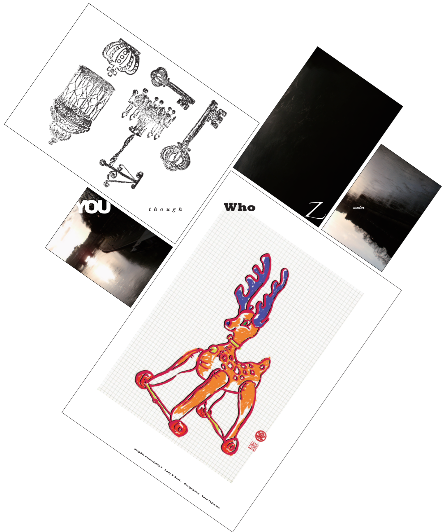
graphic potentiality 9 Eddy & Real H75.0 × W71.0cm 2012年

グラフィックデザインが本来持っている可能性「potentiality」と新しい「originality」の追求を心掛け制作している。その新しさは表層的な表現だけでなく、プロセスの開発にもウエイトを置く必要がある。最終的には、「手段」が「目的」にすり替わらぬよう、またターゲットでのバランスに注意を払いながら、視覚情報「visual communication」が持つ力を高めたいと考えている。